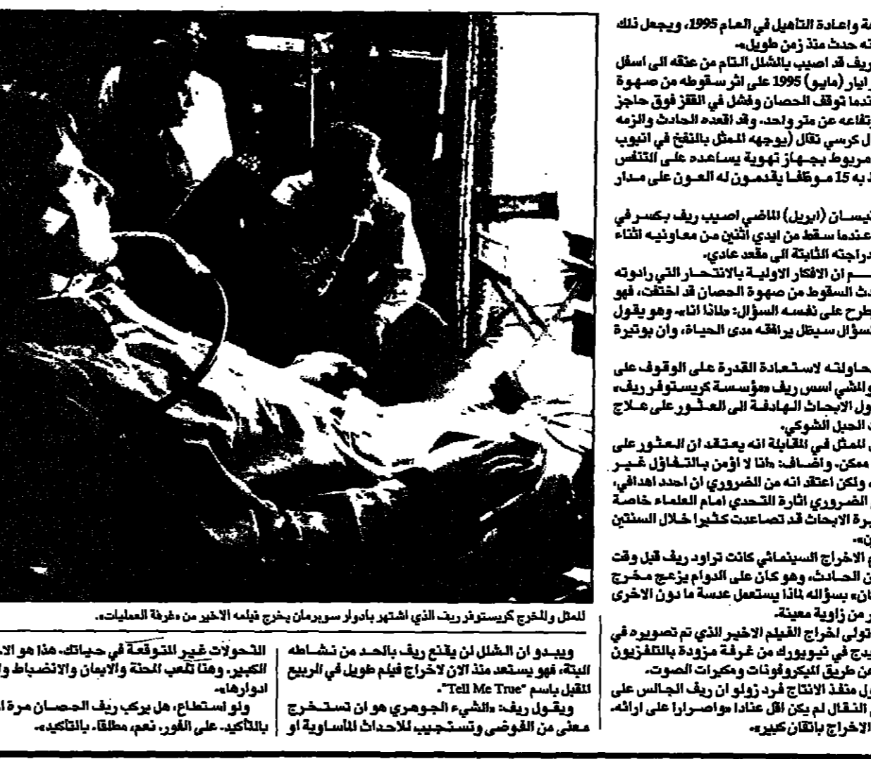
الممثل للخرج كريستوفر ريف الذي اشتهر بامور سوبرمان يخرج فيلمه الاخير من فقرة العمليات.